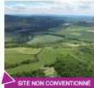
SITE NON CONVENTIONNÉ

Puy de Corent Alt. 600 m S / SO / O / NO